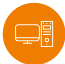
Bureautique et informatique