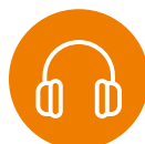
Audio & vidéo