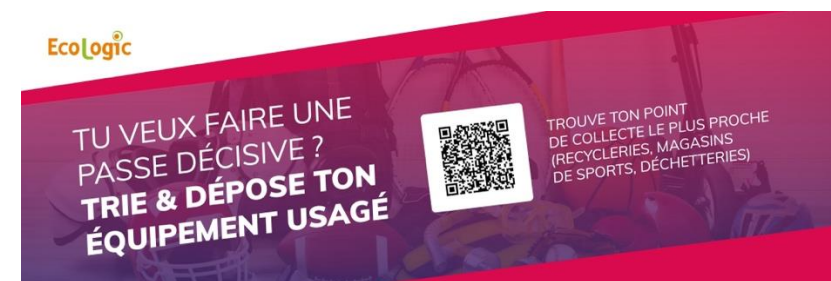
Format panneau paysage