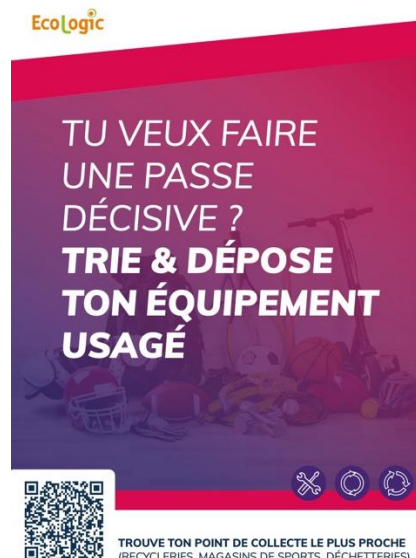
Format affiche abribus

https://www.ecologic-france.com/outils/centre-de-ressources/media/kit-de-com-pour-les-lieux-de-pratique.html