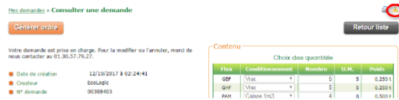
Etape 2 : Demande → « Mes demandes » Triangle jaune