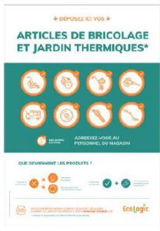
Guides et affiches magasins