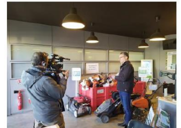
Reportage JT 20H France 2