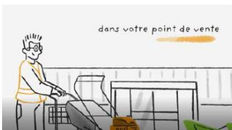
Film en magasin