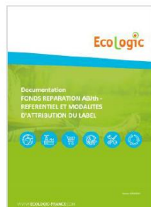
Référentiel label BonusRépar Bricolage et jardin thermique en attente de validation PP