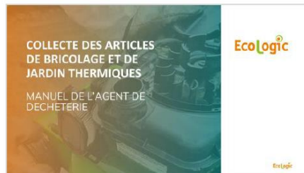
Guides et affiches déchèteries