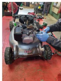
Atelier de réparation pilote