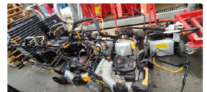
Stock d'ABJ en magasin prêt à être collecté